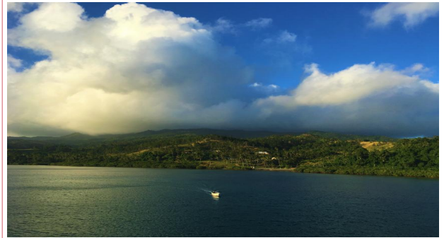
피지 대나라우 항구 현지 사진