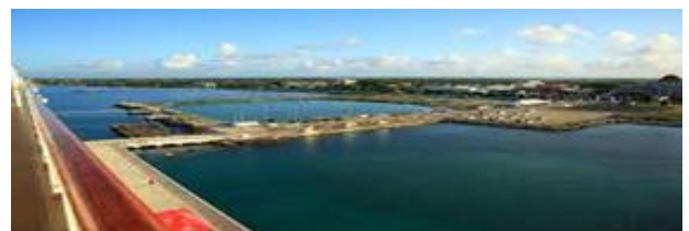
피지, 통가, 바누아투 선박육상전원(AMP) 설립 예정 부지