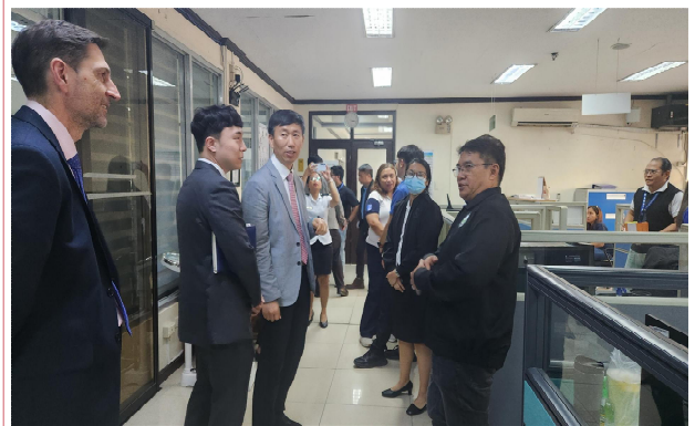
필리핀 해사청장 면담 및 기관방문(필리핀 수로국)