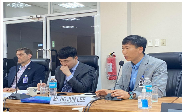
ODA 사업 착수워크숍 회의 및 한-IMO-필리핀(해경) 3자 회의