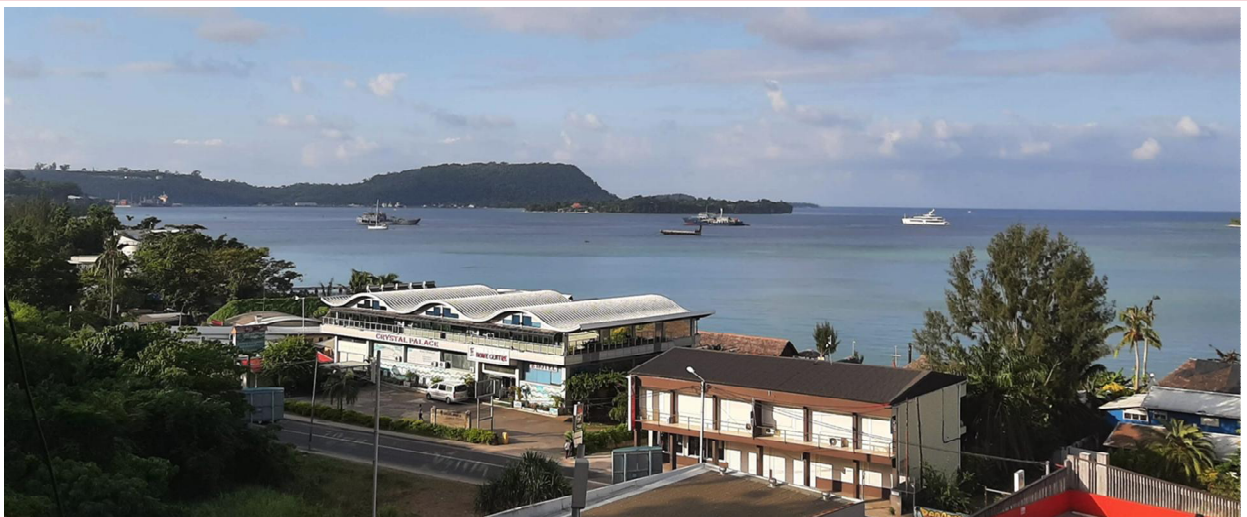
바누아투 항구 사진