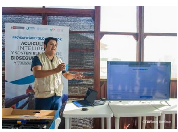
페루 반집약적 (semi-intensive) 새우 양식장 내 실시간 데이터 전송 센서 점검 현장