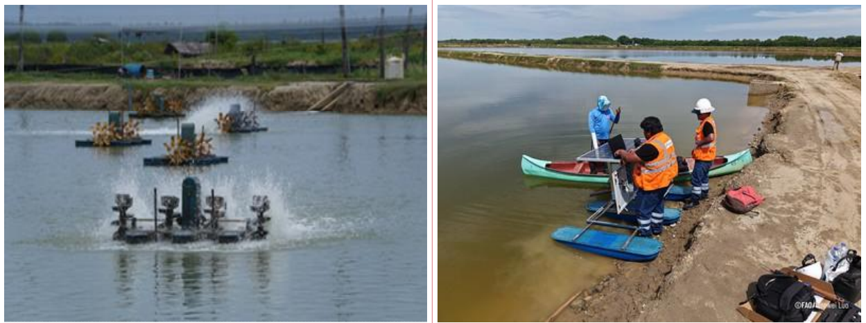
스리랑카·페루 새우 수생관리 강화를 위한 실시간 데이터 전송을 위한 양식장 센서 설치