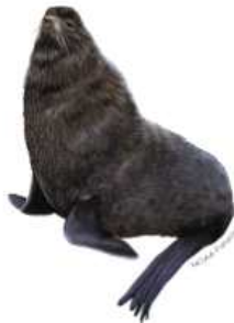
Northern Fur Seal Callorhinus ursinus